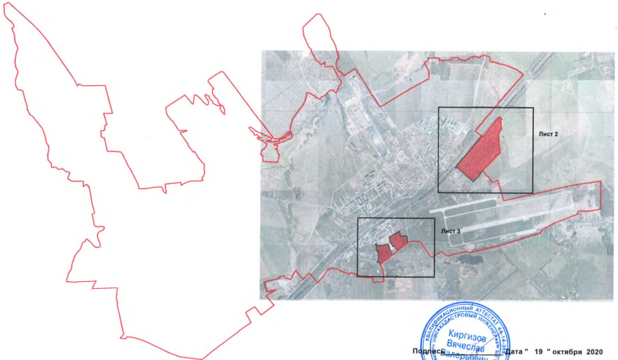
Схема расположения листов